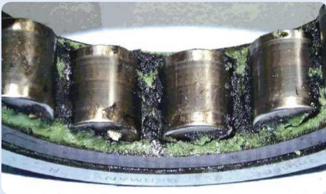
Деградация смазки, вызванная токами электрических разрядов